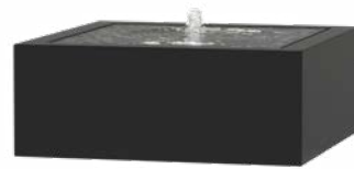
WATERTAFEL VIERKANT ALUMINIUM