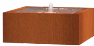
WATERTAFEL VIERKANT CORTEN