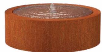
WATERTAFEL ROND CORTEN