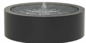
WATERTAFEL ROND ALUMINIUM